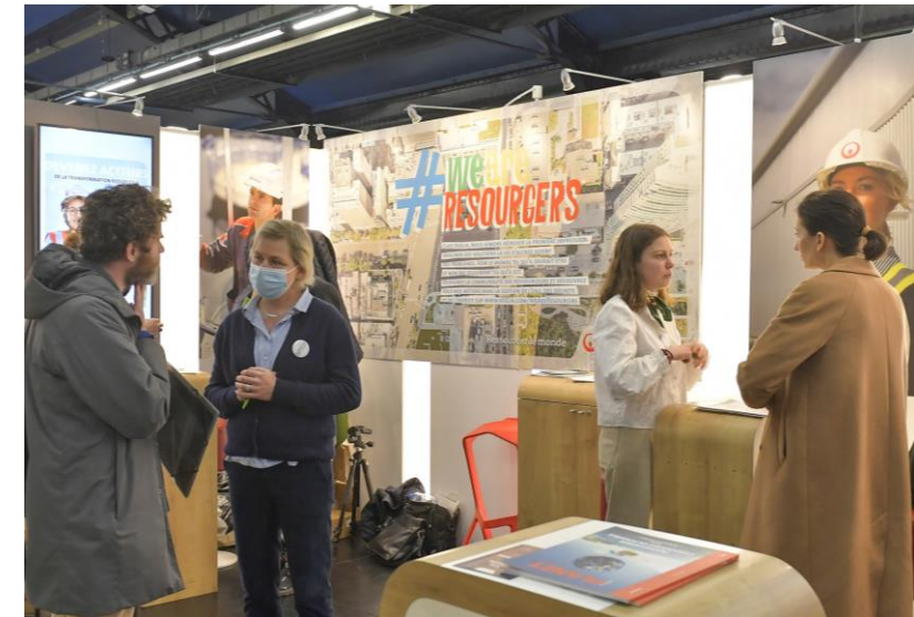
Exemples en 2024 : VEOLIA et NGE